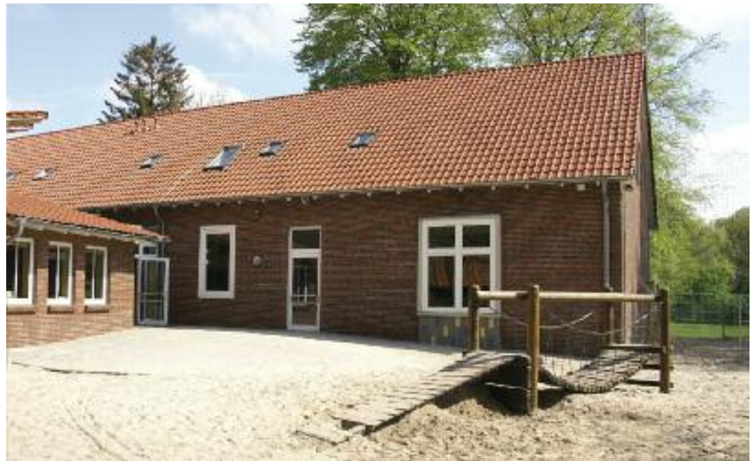
In Steinhausen sind im nächsten Schuljahr Schule und Kindergarten unter einem Dach.

Veränderungen, die dabei nicht genügend kommuniziert werden, sorgen naturgemäß bei den Eltern für Unsicherheiten und Aufregung, wie aktuell durch die sehr kurzfristige Entscheidungssituation in Steinhausen geschehen.