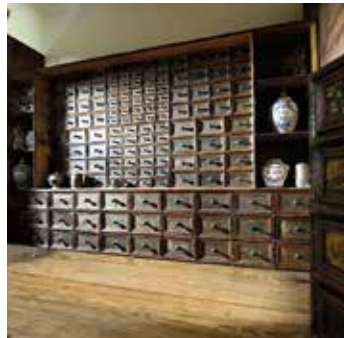
Ladeninventar im Landesmuseum