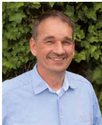
Ein Bericht von Jörn Müller

Mit Hilfe eines neuen Einzelhandelskonzeptes soll in Zetel ein weiterer Supermarkt oder Discounter platziert werden.