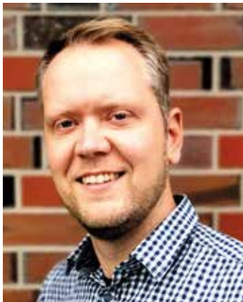
Ein Bericht von Heiko Haschen

Die Entscheidung zum Kindergartenstandort an der Uhlhornstraße hat sich die CDU-Fraktion nicht leicht gemacht. Über mehrere Wochen wurde mit allen Beteiligten diskutiert und Meinungen ausgetauscht. Nach Prüfung und Abwägung von Alternativen