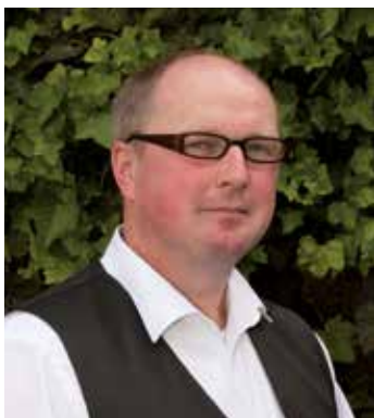
Ein Bericht von Jan Szentel

Wie in sämtlichen Bereichen der Gemeinde Zetel bleibt auch bei dem Bauhof die Zeit nicht stehen. Durch die wachsende Anzahl an Arbeitsgeräten, Fahrzeugen, Zubehör sowie inzwischen 20 Mitarbeiter*innen reicht der Platz nicht mehr aus. Außerdem geht durch das Suchen oder Beschaffen von Material von anderen Gemeindegebäuden sowie das Umfahren der Fahrzeuge viel Zeit verloren. Dabei kommen jährlich geschätzt 2200 Stunden zusammen. In Konsequenz ist ein wirtschaftliches und geordnetes Arbeiten nicht mehr möglich.