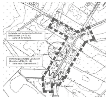
Beispiel für einen Ausschnitt aus einer Außenbereichssatzung.