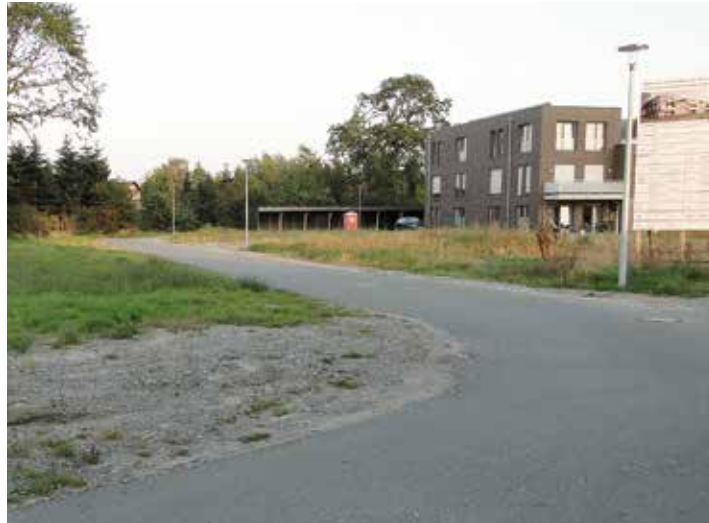
Die linke Fläche wird mit Carports, die rechte Fläche (hinter dem Schild) mit einem weiteren Mehrfamilienhaus bebaut.

2018 startete der ASB mit seinen Baumaßnahmen zur Errichtung einer Tagespflege, die Anfang