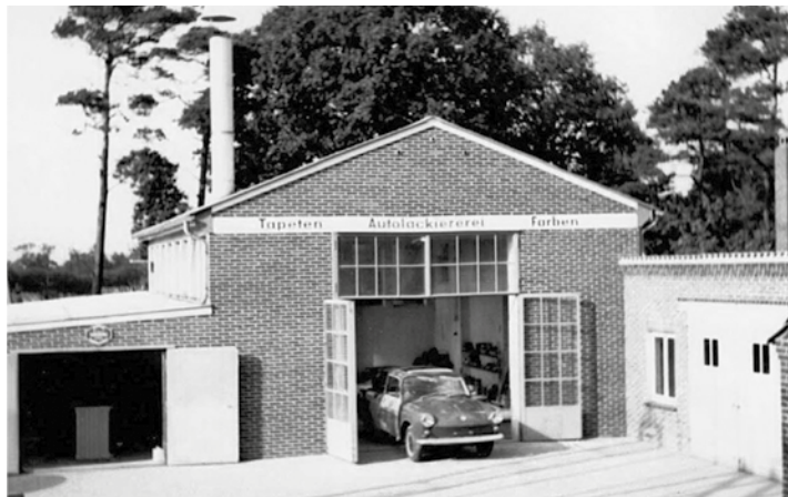
Werkstattaufnahme von 1967.