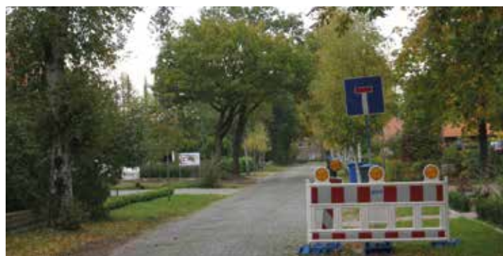
Ermöglichung der Bebauung im Außenbereich – wie hier in Bentshöcht.

Unsere Kindergärten und Grundschulen in Steinhausen und Grabstede mit ihren jeweiligen Einzugsbereichen Ellen-serdammersiel, Bockhornerfeld, Bredehorn, um nur einige zu nennen, müssen eine gesicherte Zukunft haben. Ebenso müssen wir unsere ältere Generation dabei unterstützen, für ihre Kinder und Enkelkin-der in ihrer direkten Umge-