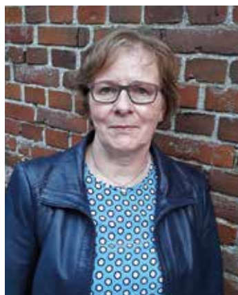
Ein Bericht von Heinke Sieckmann