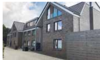
Musterhaus der WoBau Friesland

Um dem weiter steigenden Wohnungsbedarf in der Gemein-de entgegenwirken zu können, haben sich Rat und Verwaltung entschieden, der Wohnungsbau Friesland (WoBau) ein Grund-stück im Baugebiet Zetel Süd zu übertragen, um der WoBau die Möglichkeit zum Bau eines Mehrfamilienhauses zu ermög-lichen. Bauherr und Vermieter wird somit die WoBau sein, die dann dort 18 Wohneinheiten zu einem moderaten Preis anbieten wird. Gleiche Häuser sind bereits in anderen Kommunen gebaut und für gut befunden worden.