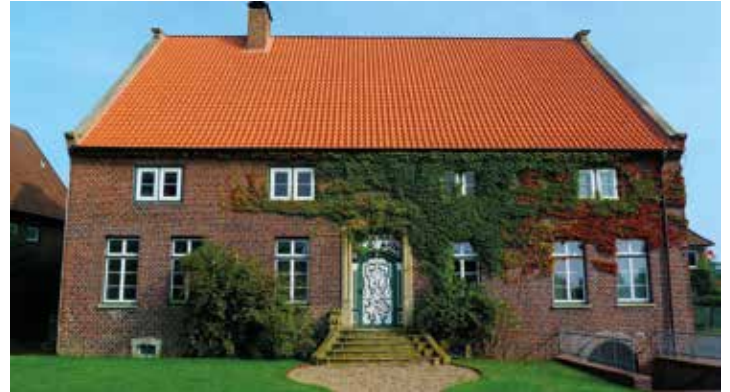
Die Rückseite des Hauses mit der Rokokotür (Aufnahme von 2011).